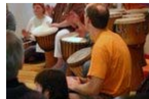
Traumfänger Zeremonie Konzert