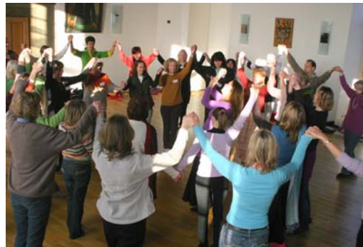
OmESH's African Spirit Drum (soft version)